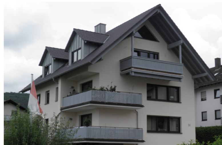
Nach der Sanierung