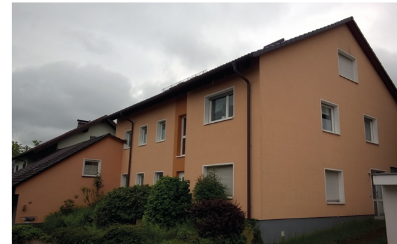
Nach der Sanierung

Lange wurde überlegt und gerechnet bis letztlich im Zusammenwirken mit einem qualifizierten Energieberater ein praktikables Sanierungskonzept entstand, dass die Hausbank mit Hilfe von KfW-Fördermitteln vorbildlich begleitete. So konnten im Jahre 2009 für das bereits 1971 gebaute Einfamilienhaus mit ca. 240 m 2 Wohnfläche die KfW-Standards für ein „Effizienzhaus-100“ erfüllt werden. Seit 2010 arbeitet die Heizung schadstofffrei und kostenneutral.